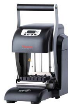
ALPS 50V 半自動ヒートシーラー