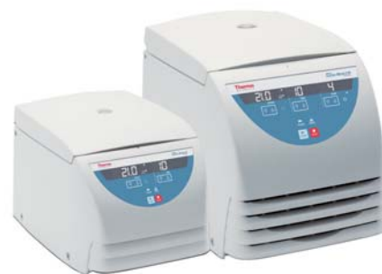
Micro 21 (冷却無)