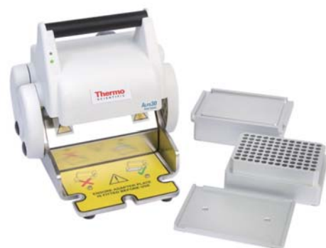
ALPS30 マニュアルヒートシーラー