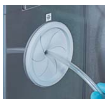
Thermo Scientific™ SmartPort™