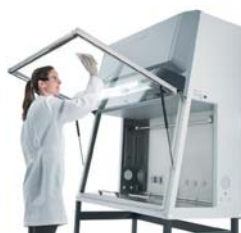
Thermo Scientific™ SmartClean Plus