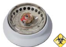
ローター (標準付属品) 製品番号: 75003424